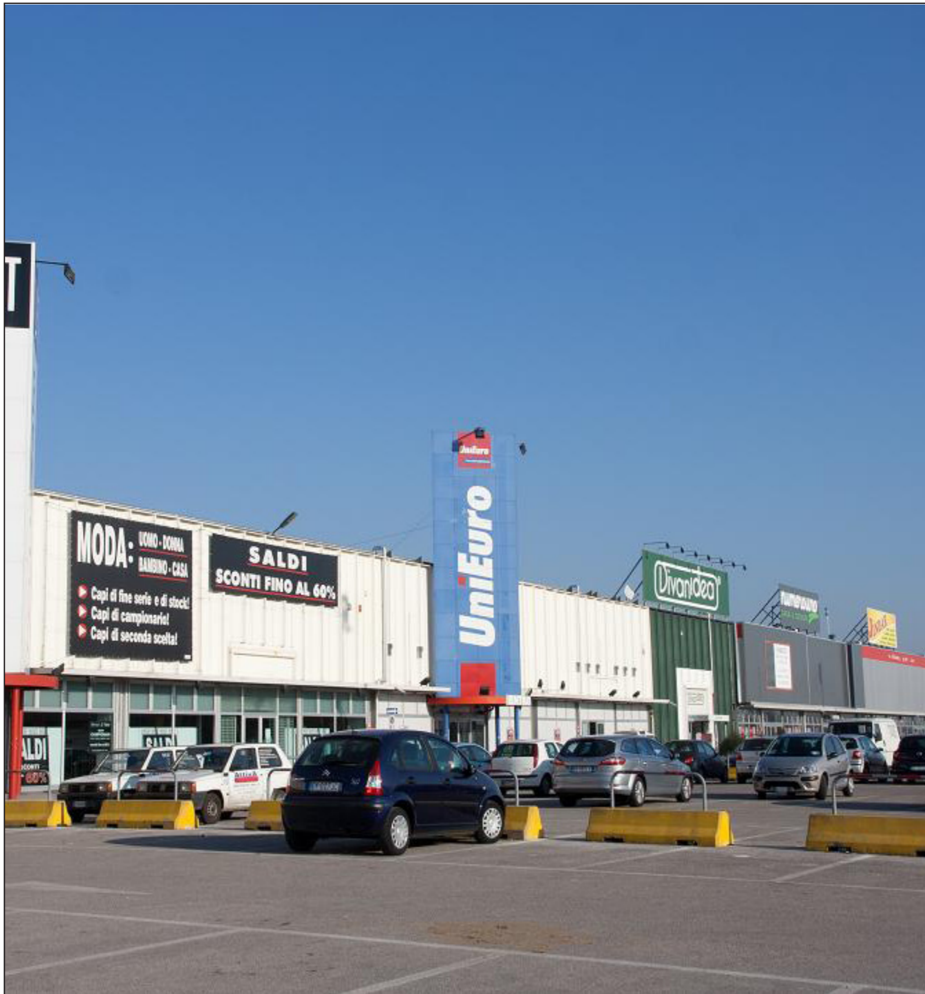
vista Complesso Romea